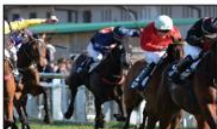
Robert POLIN Photographe

170, bd de l'Europe - 44 200 LESCAR - Tél. 05 59 81 30 18