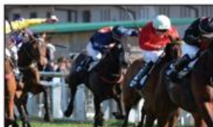
Robert POLIN Photographe

170, bd de l'Europe - 44 200 LESICAR - Tél. 05 59 81 30 18